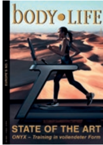
38. Jahrgang 2025

body LIFE ist Marktführer in Deutschland und erscheint als einziges Branchenmedium in monatlichem Rhythmus. Der hohe Leserutzen und das innovative Konzept verschaffen body LIFE diese starke Machtposition. Das Fachmagazin mit mehr als dreissigjähriger Tradition ist Pflichtlektüre für alle, die über das Innenleben der Fitness- und Gesundheitsbranche Bescheid wissen wollen. body LIFE-Leser