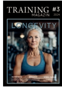
2. Jahrgang 2025

TRAINING MAGAZIN ist ein neu-gegründetes Special-Interest-Magazin, das Anfang 2024 aus der Fusion von TRAINER und FUNCTIONAL TRAINING MAGAZIN entstanden ist. Es wendet sich an Personal Trainer, Physiotherapeuten, Sportmediziner und ambitionierte Freizeitsportler. Der Inhalt setzt sich aus Berichten und Interviews zu Training in all seinen Facetten, Mobility, Conditioning, Ernährung und Rehabilitation zusammen. Online wird das neue TRAINING MAGAZIN flankiert von der etablierten Sportseite trainingsworld.com .