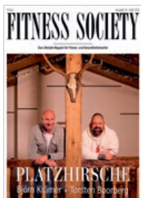
6. Jahrgang 2025

FITNESS SOCIETY ist die Lifestyle-Marke für Fitness- und Gesundheitsmacher: In ist, wer drin ist. Das Branchen-Magazin besticht mit aufwändig recherchierten und spannenden Hintergrundreports, Homestories, Interviews, Eventberichterstattungen und News. Hier steht der Mensch im Mittelgrund: Die Redaktion porträtiert bild- und textgewaltig die bekanntesten und einflussreichsten Szenepersönlichkeiten und ihr Business,