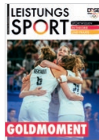
55. Jahrgang 2025

LEISTUNGSSPORT bietet den Top-Trainern des Landes relevante Informationen zu ihrer Sportart und nützliche Hintergrundberichte aus anderen Disziplinen. Besonderer Wert wird dabei auf die Verwertbarkeit der Beiträge für die Praxis gelegt. Neben den neuesten Erkenntnissen und Untersuchungsergebnissen enthält das vom Deutschen Olympischen Sportbund DOSB herausgegebene Magazin auch News, Trends